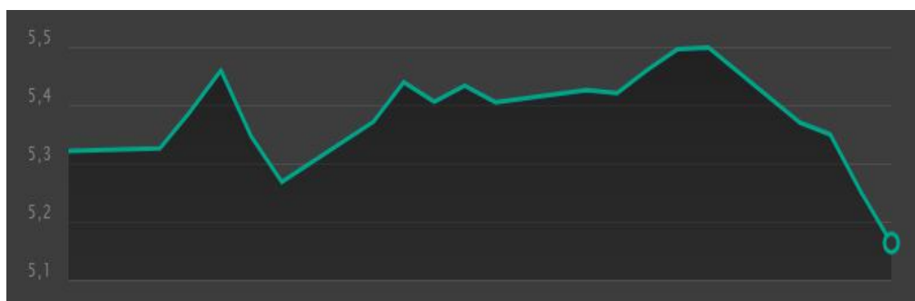
本月美元/雷亚尔汇率走势