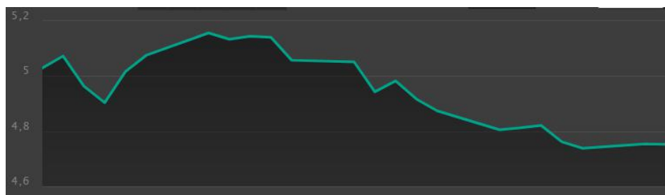
本月美元/雷亚尔汇率走势

本月雷亚尔的表现现在主要新兴市场货币中排名第三，仅次于俄罗斯卢布和哥伦比亚比索。